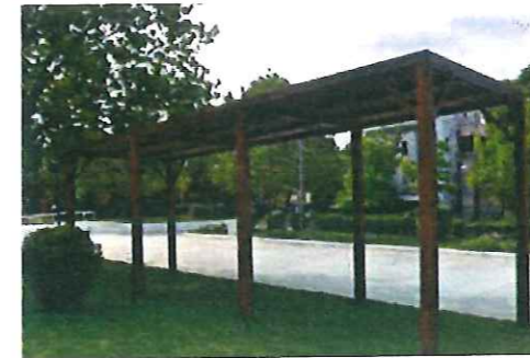
Μορφή ξύλινης πέργκολας