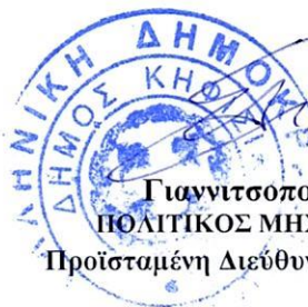
Γιαννιτσοπούλου Ελένη ΠΟΛΙΤΙΚΟΣ ΜΗΧΑΝΙΚΟΣ ΠΕ/Α'

Προϊσταμένη Διεύθυνσης Τεχνικών Υπηρεσιών