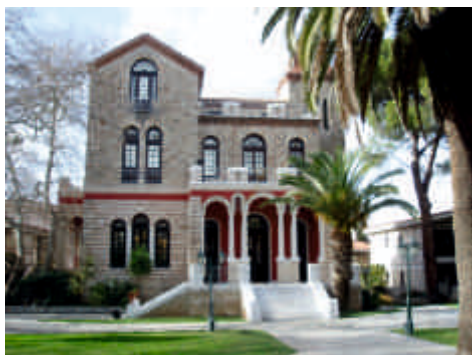
Έπαυλις Σταθάτου, 1890

Η Κηφισιά είχε χαρακτηριστεί εβδομήντα χρόνια πριν, ως «προάστιο - μουσείο» για τα πιο «επιδεικτικά και εκκεντρικά δείγματα αρχιτεκτονικής που δεν έχει ταίρι του στην Ευρώπη» από τον Βρετανό συγγραφέα, τεχνοκριτικό και αρθρογράφο αρχιτεκτονικών περιοδικών, Όσμπερτ Λάνκαστερ (Sir Osbert Lancaster, 1908 – 1986).