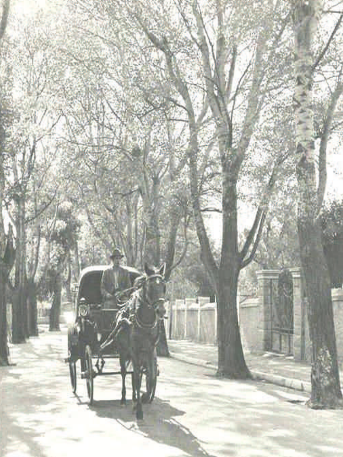
Οδός Αθηνών 1930