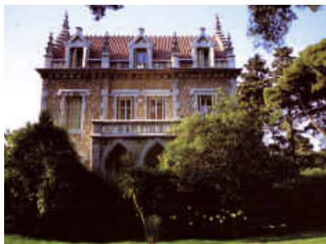
Έπαυλις Π. Πρωτοπαπαδάκη, 1897

Η καταπράσινη περιοχή Στροφύλι με τα ιστορικά διατηρητέα σπίτια της.