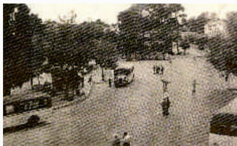
Πλατεία Μελά 1948

την ενεργό συμμετοχή τους στα ανώτατα αξιώματα του Αθηναϊκού κράτους, είχαν και ιδιαίτερο ενδιαφέρον για τα γράμματα και τις τέχνες.