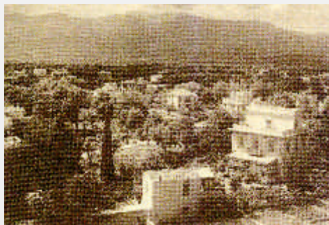
Ξενοδοχείο «ΠΑΛΑΣ» 1936