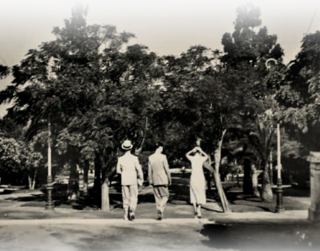
Το «Άλσος» Κηφισιά, 1901