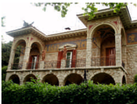
Βίλα «Ατλαντίς», αρχιτέκτων Ε. Τσίλλερ, 1897

Ακόμα και σήμερα χαίρεται κάποιος να περπατά ή να απολαμβάνει με το ποδήλατό του τις διαδρομές ανάμεσα στις παλιές αρχοντικές οικίες και επαύλεις.