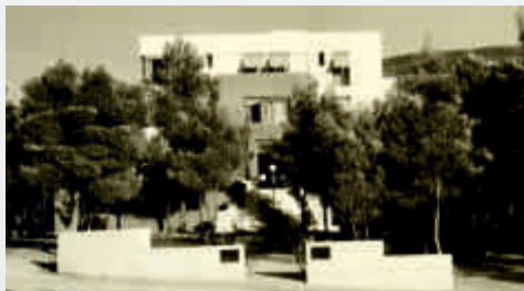
«HOTEL DIANA», Εκάλη

Η αρχιτεκτονική και η πολεοδομική σύνθεση της Εκάλης, δημιούργησε ένα μοναδικό προάστιο, με «αρχιτεκτονικό μέτρο του πεζό και όχι το όχημα» (Γ.Κ) .