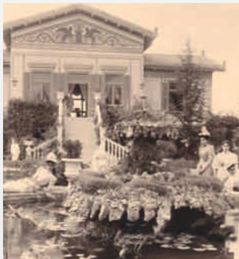
Έπαυλις «Βούρου» 1895

Με τη “Νέα Αττική Κωμωδία” , ο Μένανδρος αποτέλεσε το πρότυπο για τους Λατινούς κωμωδιογράφους, μέσα από τους οποίους επηρέασε τη Νεότερη Ευρωπαϊκή Κωμωδία και σφράγισε το παγκόσμιο θέατρο.