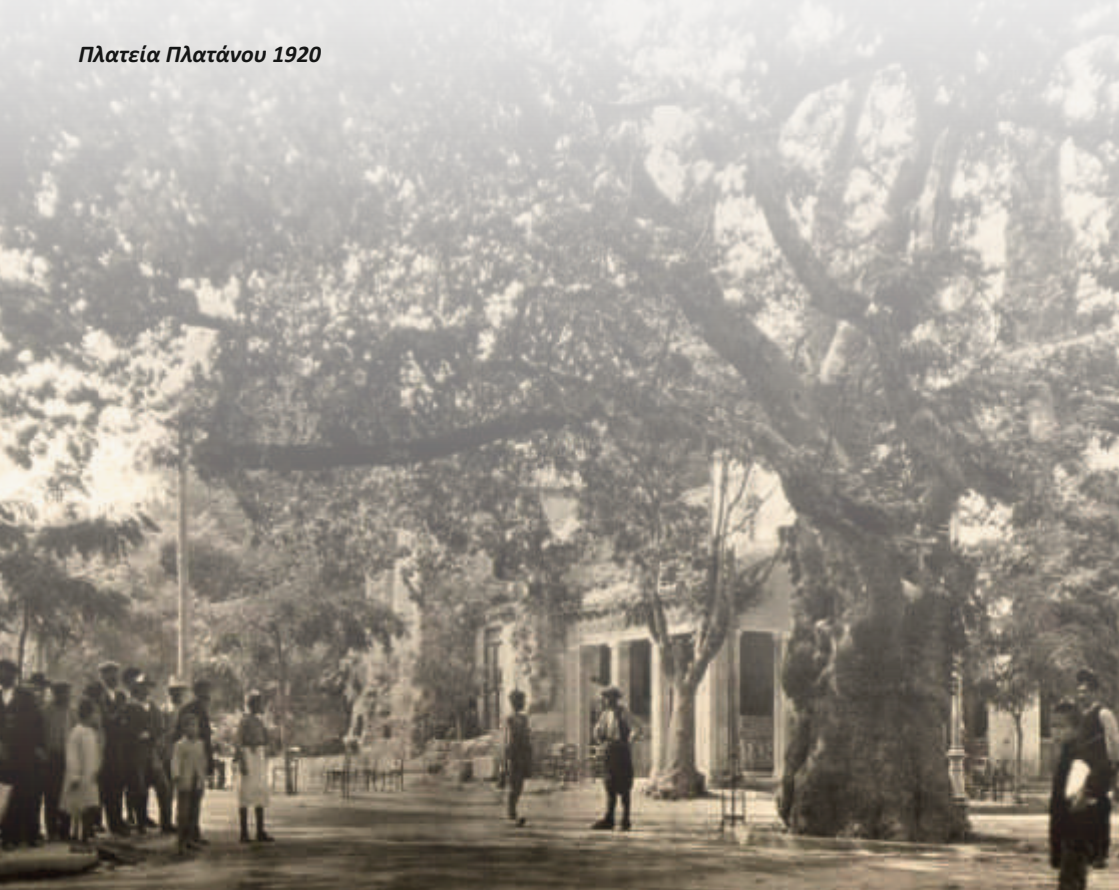
Πλατεία Πλατάνου 1920

Στις 29 Ιανουαρίου του 1943 , η Κοινότητα Κηφισιάς αναγνωρίστηκε ως Δήμος.