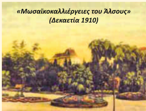
« Μωσαϊκοκαλλιέργειες του Άλσους (Δεκαετία 1910)

Το 1896, χρονιά των Ολυμπιακών Αγώνων της Αθήνας, στην πλατεία Πλατάνου οργανώνεται αγορά « Ανθέων και καρπών » όπου ήταν εκτεθειμένα τα προϊόντα τους πάνω σε πάγκους και τραπέζια. Οι διοργανωτές επονόμαζαν την εκδήλωση « Εκθεση ».