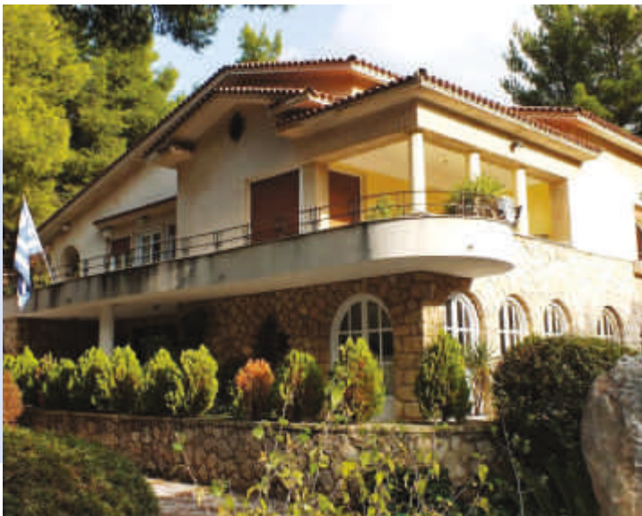
«Βίλα Κώστα», δεκαετία 1930

Λουκή Ακρίτα 4, Νέα Ερυθραία , 2106206190 www.kemme.gr | pk_dne@otenet.gr