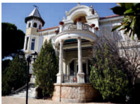
Έπαυλις Βουδούρη, πρώην Ζούρα, 1872