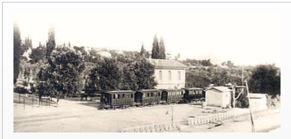
Σταθμός Κηφισιάς με το «θηρίο» (δεκαετία 1890)